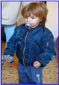
Bomber MA-1 Children (Bambino) Vintage Made in USA